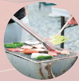
地元の名産を使った BBQ (18日晩)