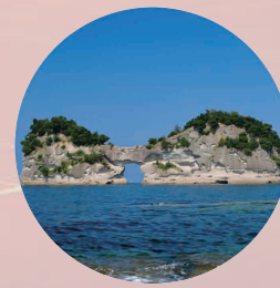
早朝クルージング体験 (19日朝)